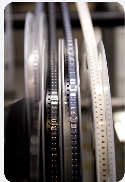
Kostengünstige Beschaffung elektronischer Bauteile

Mit einer Software-Evaluierung vor der ersten Fertigung können wir überprüfen, ob eine Baugruppe fehlerfrei und kostengünstig gefertigt werden kann. Unsere Erstmusterprüfung basiert auf dem Standard für die Produktionsprozess und Produktfreigabe, PPF des VDA. Jeder Kunde erhält einen ausführlichen Report über Auffälligkeiten und mögliche Einschränkungen bei der Fertigungseignung seiner Baugruppe.