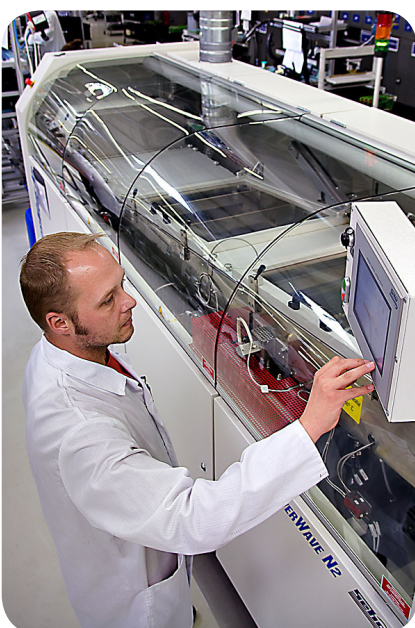
Moderne Fertigungs- und Prüfanlagen

Mit modernsten Bestückungsanlagen, einer effizienten Organisation und einer kostengünstigen Beschaffung mit Tochterfirma direkt in China und Taiwan und einer hocheffizienten Fertigung erzielen wir in Deutschland Gesamtkostenvorteile. Die Kommunikation mit unseren Kunden ist besser, die Prozesskette ist effektiver, die Wege sind kürzer, die Fehlerkosten sind geringer und die Materialkosten können wir niedrig halten.