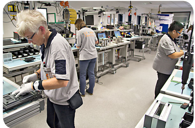
Fertigung und Komplettgerätemontage aus einer Hand

Mit der Fertigung und der Komplettgerätemontage aus einer Hand können wir unseren Kunden einen Mehrwert bieten und die Auslieferungen beschleunigen. Darüber hinaus haben unsere Montageteams durch tägliche Verbesserungsrouinen ihre Fähigkeiten trainiert, auch komplexe mechanische Montagearbeiten in kurzer Zeit und mit selbst entwickelten Lösungen umzusetzen. Dafür steht eine eigene Werkstatt mit Vorrichtungsbau zur Verfügung.