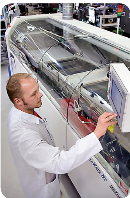
Moderne Fertigungs- und Prüfanlagen

Mit modernsten Bestückungsanlagen, einer effizienten Organisation und einer kostengünstigen Beschaffung mit Tochterfirma direkt in China und Taiwan und einer hocheffizienten Fertigung erzielen wir in Deutschland Gesamtkostenvorteile. Die Kommunikation mit unseren Kunden ist besser, die Prozesskette ist effektiver, die Wege sind kürzer, die Fehlerkosten sind geringer und die Materialkosten können wir niedrig halten.