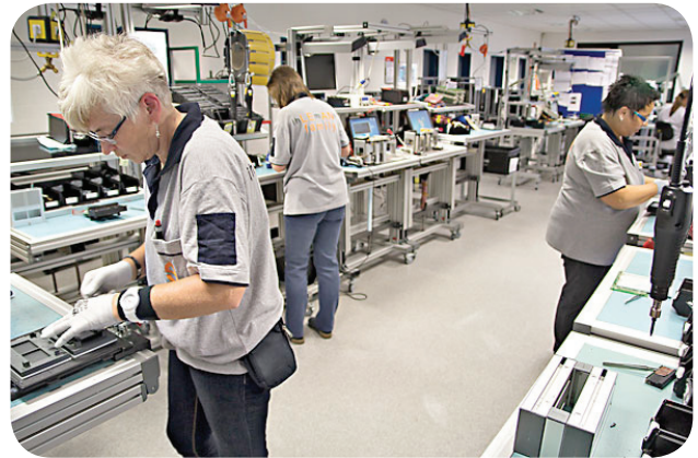
Fertigung und Komplettgerätemontage aus einer Hand

Mit der Fertigung und der Komplettgerätemontage aus einer Hand können wir unseren Kunden einen Mehrwert bieten und die Auslieferungen beschleunigen. Darüber hinaus haben unsere Montageteams durch tägliche Verbesserungsroutrinen ihre Fähigkeiten trainiert, auch komplexe mechanische Montagearbeiten in kurzer Zeit und mit selbst entwickelten Lösungen umzusetzen. Dafür steht eine eigene Werkstatt mit Vorrichtungsbau zur Verfügung.