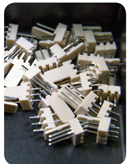
Obsoleszenz Management zum Schutz gegen die Abkündigung von Bauteilen